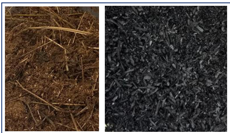
Figur 3. Hästgödsel (spån som strömaterial) och biokol – två fiber-material som tillsätts i reaktorförsök med samrötningssubstrat vid LiU inom BRC's forskningsområde Ökat Värde ur Digestat.

Ytterligare ett område där studier har påbörjats är hur tillsats av fiber-rikt material till ett blandat substrat dominerat av matavfall påverkar rötrestens egenskaper och möjligheterna att separera ut en fast fas. I en första fas jämförs hur tillsats av hästgödsel respektive biokol (Fig. 3) påverkar gasutbytet, metanhalt och andra driftsvariabler, samt rötrestens avvattningsegenskaper.